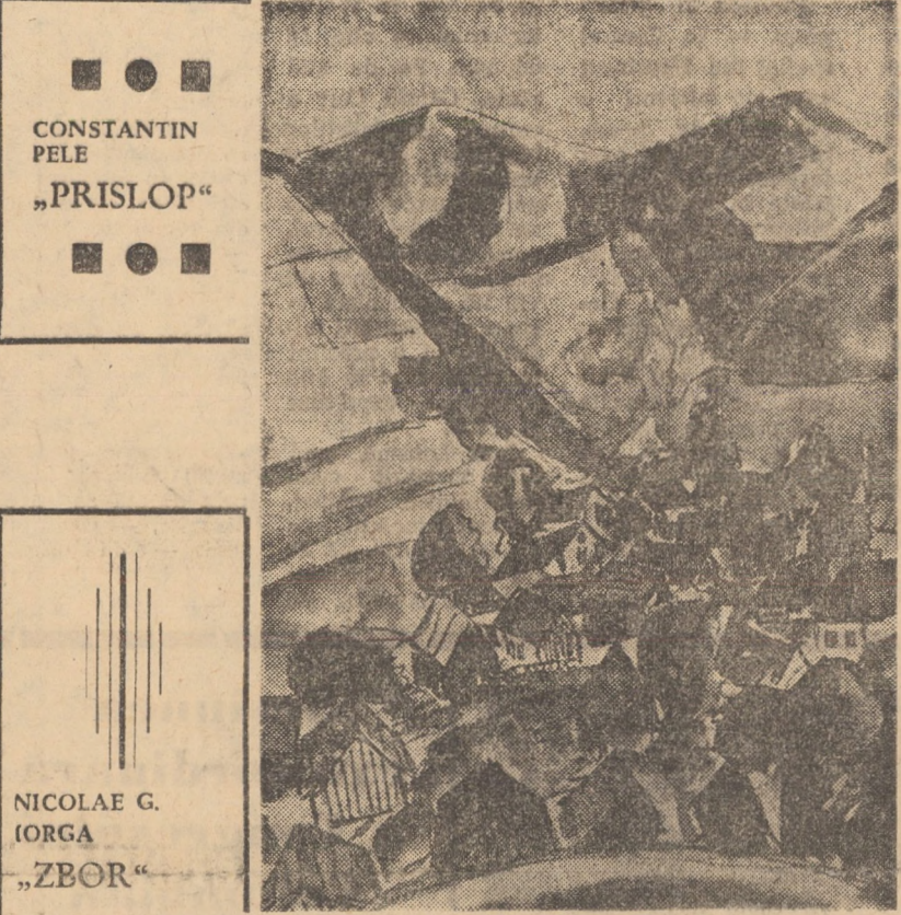
CONSTANTIN PELE „PRISLOP”