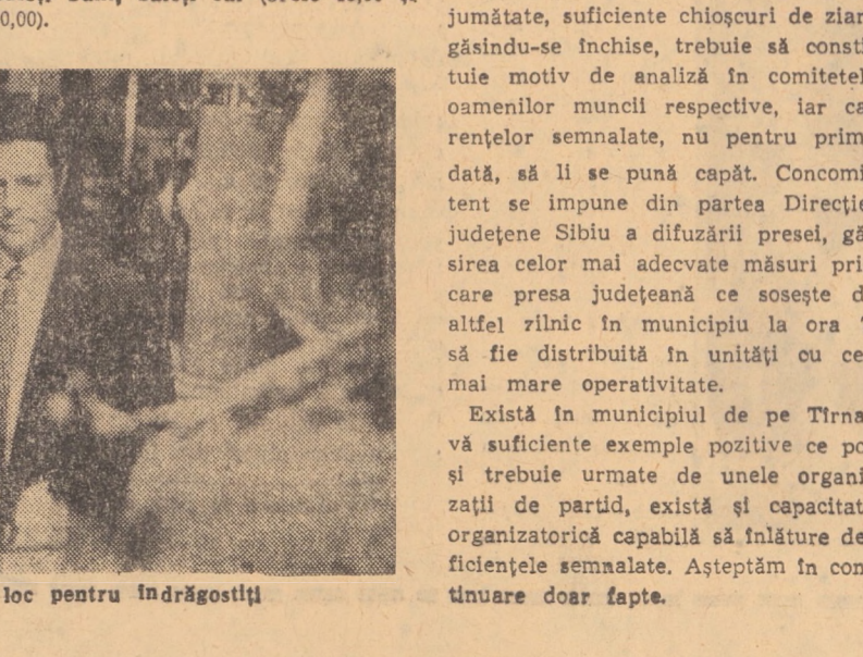
Cadru din filmul Un loc pentru îndrăgostii

9.00 Deschiderea emisiunii de dimineață. Telex. 9.05 Biblioteca pentru toti. I. L. Caragiale (II). 9.50 De vorbă cu gospodinele. 10.05 Teledicționar (rețuare). 10.50 Anchetă TV. Radiografa unei mîntăliști (rețuare). 11.20 Drumuri în istorie (rețuare). Muzeul de istorie al Republicii Socialiste România (IV). 11.45 Teatru scurt. „Mama s-a înfrăgostit” de Ion Bălescu (rețuare). 12.20 În stîmba sănății. 12.45 Teledurnal. 16.20 Deschiderea emisiunii de după-amiază. Emisiune în limba germană. 18.00 În direcți: Start în cursa automobilistică de 24 de ore de la Mans. 18.15 Rîm, tinerete, dans. 19.00 Săptămîna în imagini. 19.20 1 001 de seri. 19.30 Teledurnal. 20.00 În întîmpinarea