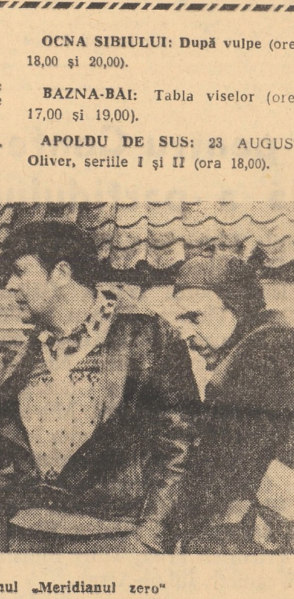
Cadru din filmul „Meridianul zero”

OCNA SIBIULUI: După vulpe (orele 18,00 și 20,00). BAZNA-BAI: Tabla viselor (orele 17,00 și 19,00). APOLDU DE SUS: 23 AUGUST: Oliver, seriile I și II (ora 18,00).