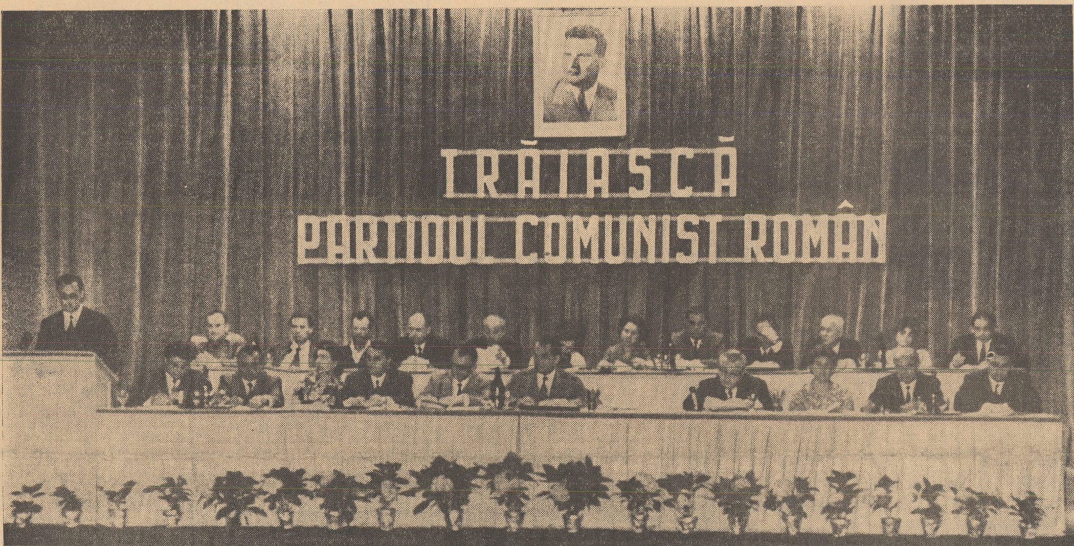
Prezidiul Conferinței extraordinare a organizației județene Sibiu a P.C.R.