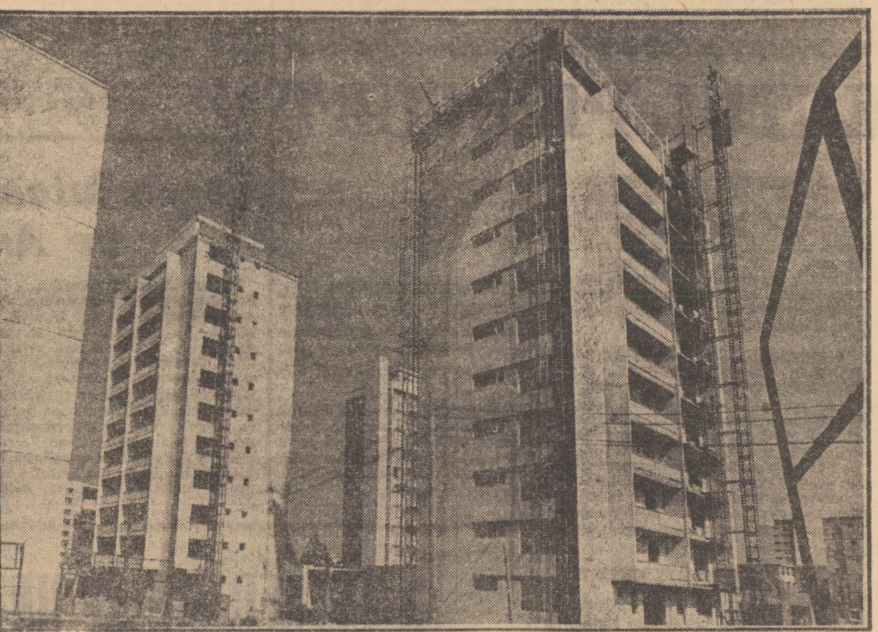
Secvență de pe șantierul de construcții din cartierul Hipodrom Sibiu: blocurile turn T3, T4 și T5.