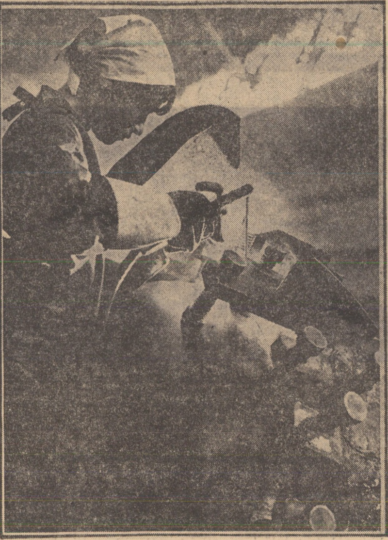
Într-un scurt de la o mbrăgărit meseria de sudor la uzina „Inveiderșii” Sibiu, učenja Ioana Tomoroga, din secția cazangerie, a reușit să execute lucrări de bună calitate.