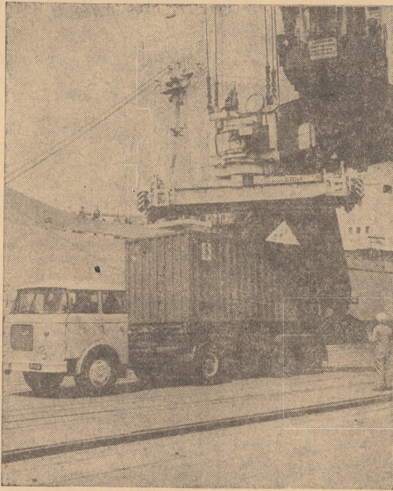
„Ostrolenka-B” au dat în exploatarea lui la rețeaua energetică a R.P. Polone.

La rîndul său, ministrul chinez a declarat că China sprijină cu fermitate lupta poporului pakistanez de salvagardare a demnității naționale, întrucît aceasta este o luptă justă. Scopul vizitei mele — a spus el — este întărirea prieteniei dintre cele două țări prietene și suverane. El și-a exprimat convingerea că poporul pakistanez va trece peste dificultățile temporare și va obține noi succese în construcția propriei sale țări.