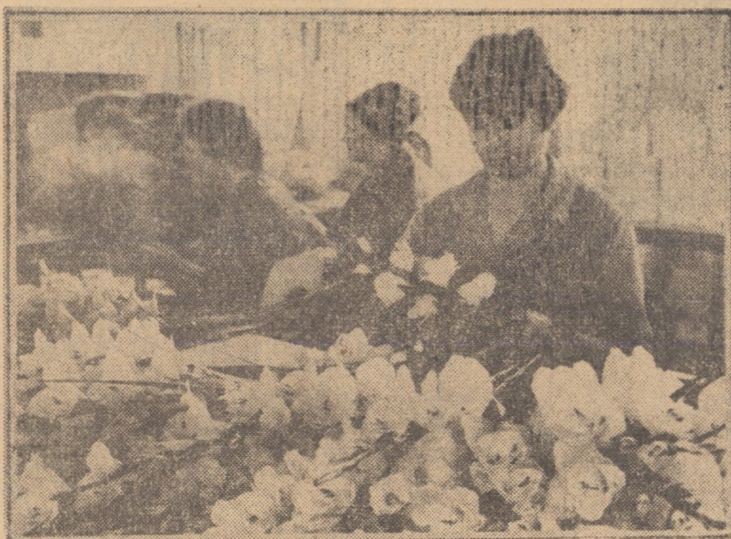
În „grădina” cu flori artificiale de la „Flaro” Sibiu.