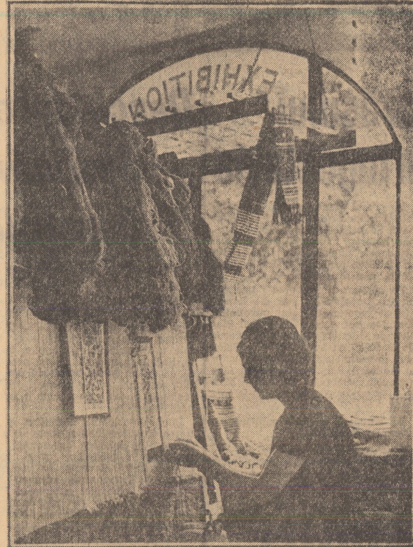
Război de jesu covoare orientale la cooperativa „Arta Sibiului”, din localitate.

jurat. Una din modificările tehnologice de mare importanță efectuate la fabrica de acid sulfuric este aceea privind înlocuirea suflăntelor de tip vechi cu turbosulfantii.