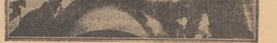
Instalație automată de sudură a flanșelor de uzină „Independența” din Sibiu

Încă în luna trecută, Mediaș s-a deschis, complet rețcut, un magazin de autoservire pentru produse chimice. Se dispune de un bogat asortiment de produse chimice. După mai mult de un an de activitate, magazinul este responsabilul magazinului de la profilarea costului de autoservire, numărul cumpărătorilor s-a dublat.