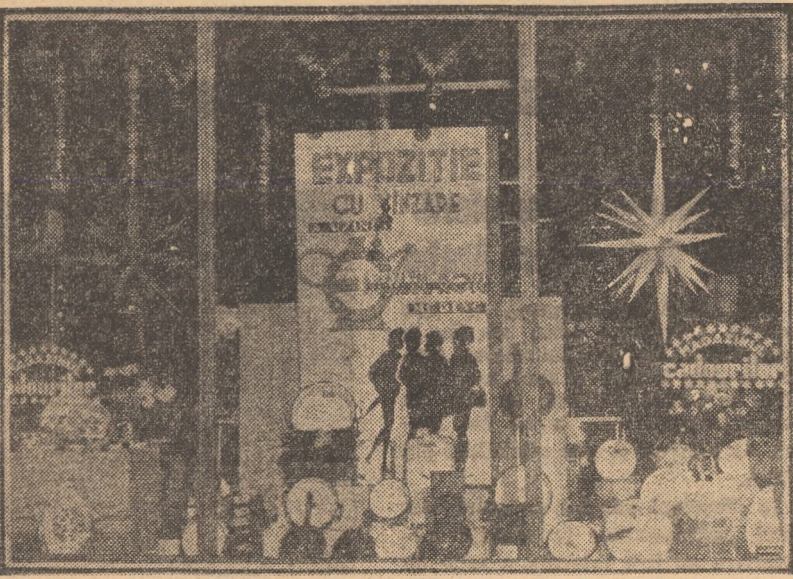
„Luna cadourilor” oglindește într-una din vitrinele magazinului „Fero-metal” din Sibiu