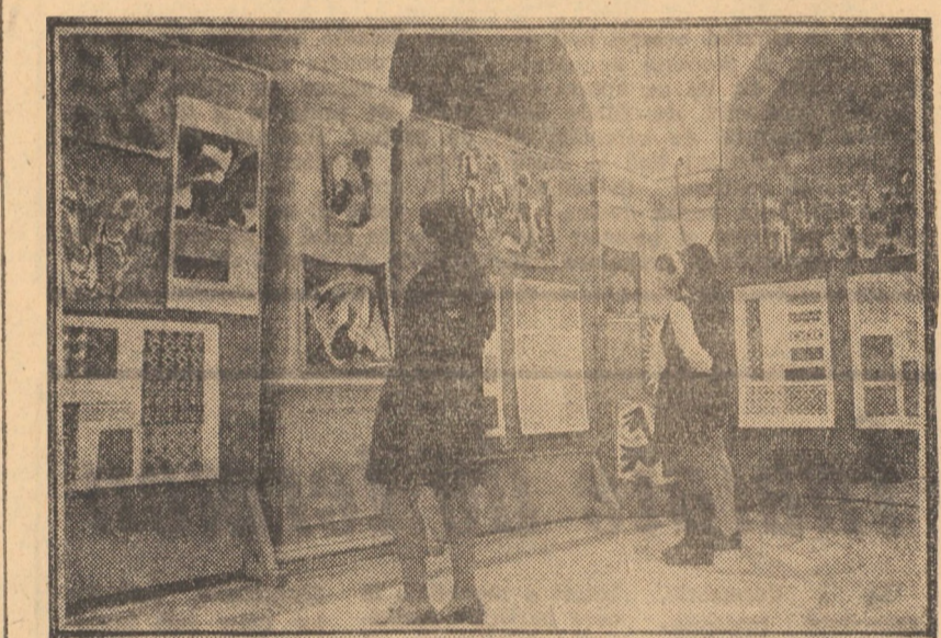
Cadru dintr-o reușită expoziție de artă decorativă, prezentată în holul Liceului de muzică și arte plastice Sibiu

Metodă originală de decorare a sticlei În S.U.A. s-a extins utilizarea unei metode de obținere a unor ambalaje originale și străgătoare, denumită „Spectraglass”. Conform procedurii, în locul coloranților întregii mase de sticlă din bazinul cuptorului, s-a conceput metoda introducerii coloranților imediaț înaintea mașinii de suflare, printr-un sistem special de alimentare. Dacă, după colorare, masa de sticlă, se fazează prin presare în formă, se pot obține articole cu suprafața în relief. Prin combinarea efectului de texturare superficială cu cel de colorare se pot realiza o serie de contraste de culori și de efecte decorative deosebit de străgătoare, reducîndu-se concomitent sensibilitatea la murdărire pe partea exterioară a pereților ambalajelor.