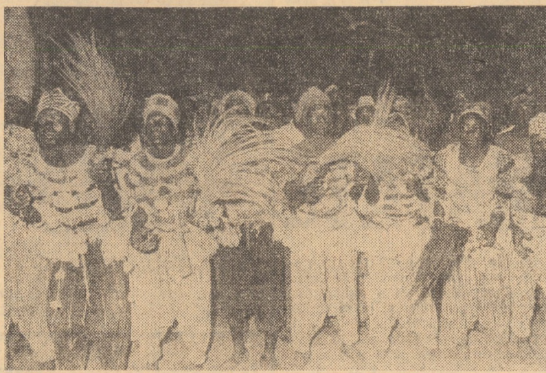
VOLTA SUPERIOARĂ. Spectacol oferit de o echipă de dansatori din Volta Superioară

În discursul adresat de șeful statului participanților la această manifestare au fost relevate o serie de succese obținute în domeniile social și cultural, subliniindu-se, de asemenea, că politica externă a U.E.A. este orientată spre cooperarea cu țările arabe în toate domeniile și spre o colaborare largă cu celelalte state, pe baza prevederilor Cartei O.N.U.