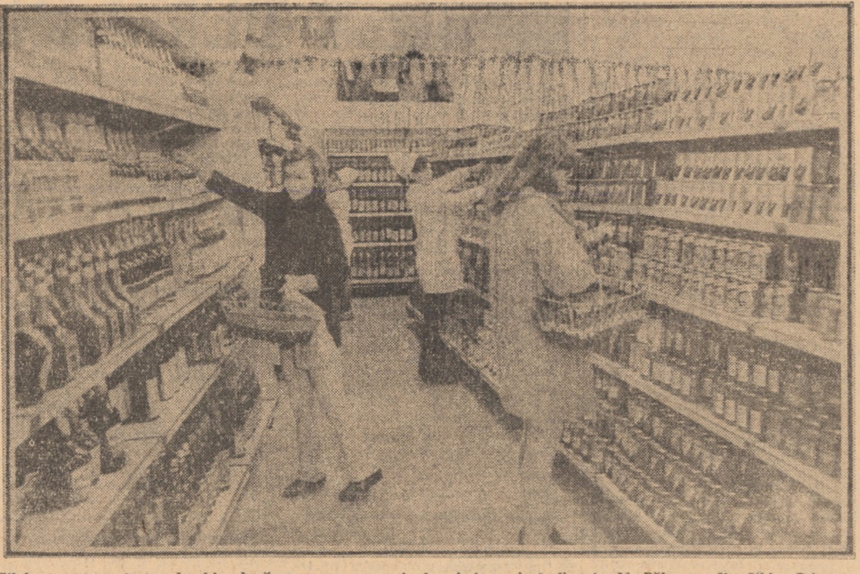
Zilele trecute a fost redeschis, după renovare, magazinul „Autoservire” din str. N. Bălcescu din Sibiu. Prin amplasarea judicioasă a noului mobilier — rafturi, congelatoare, vitrine frigorifice etc. — spațiul disponibil e folosit mai rațional, creîndu-se posibilitatea unui flux continuu de prezentare a mărfurilor.

Casa artelor din Sibiu găzduiește astăzi una dintre cele mai prestigioase manifestări ale anului cultural sibiian 1972. Începînd cu ora 12 aici are loc vernisajul salonului județean de pictură și sculptură, dedicat celei de a XXV-a aniversări a republicii. Organizat de Comitetul județean pentru cultură și educație socialistă și de filiala Sibiu a Uniunii Artiștilor Plastici, salonul reunește personalitățile cele mai reprezentative ale artei plastice sibiene, cu lucrări semnificative pentru sfîrșitul artistic deșfurat de fiecare artist, în liniștea gravă a atelierelor, în ultima perioadă de timp.