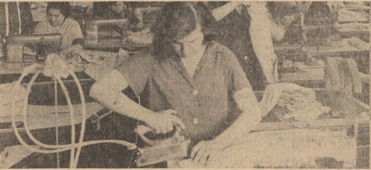
Flux tehnologic reorganizat odată cu darea în folosință a noilor spații de producție la fabrica de confecții „Steaua roșie” Sibiu