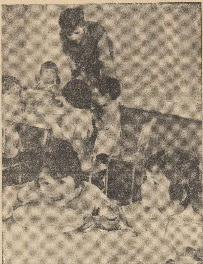
Poftă mare! Secvență la ora prinzului în noua grădiniță de copii din cartierul Gura Cimpului din Mediaș.