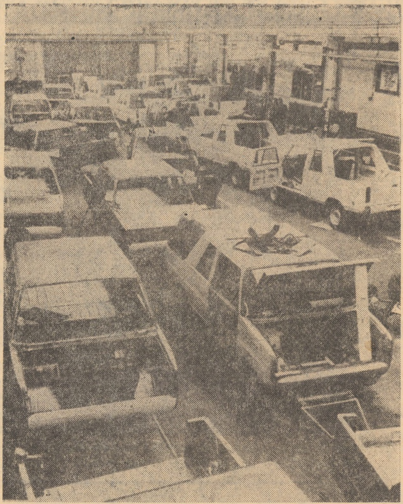
R.P. POLONĂ: Aspect din secția de montaj a autoturismului de teren „TARPAN” din cadrul fabricii de mașini agricole din Poznan-Antoninek

În zilele de 4-6 februarie, a avut loc la Budapesta întâlnirea de lucru a președinților celor două părți ale Comisiei mixte guvernamentale de colaborare economică între Republica Socialistă România și Republica Populară Ungară. În cadrul