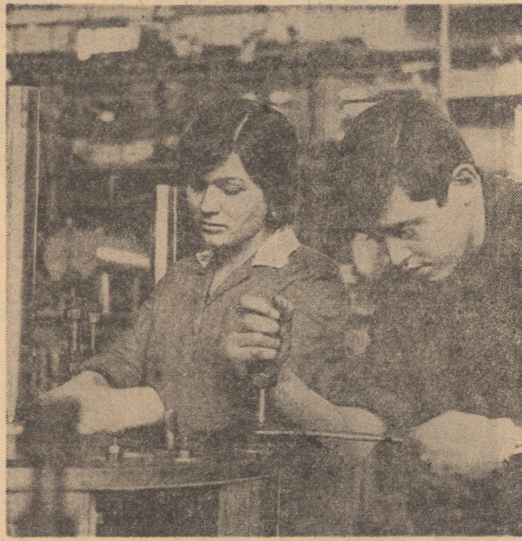
Preșcolarii în întreprinderi pot fi întîlniți elevii din diferite școli, efectuînd orele de practică direct la locurile de producție