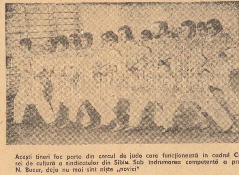
Acești tineri fac parte din cercul de judo care funcționează în cadrul Casei de cultură a sindicatelor din Sibiu. Sub îndrumarea competentă a prof. N. Bucur, deja nu mai sînt niște „novici”

Stațiunea Păltiniș a găzduit luni și marți, etapa județeană a „Cupei tineretului” la sanie, cros pe schi și schi-slalom. La întrecerile desfășurate într-o organizare ireproșabilă, au participat 241 concurenți, elevi și tineri, care s-au calificat în etapele anterioare. Iată ordinea primilor trei clasificați: