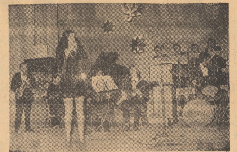
În imagini: aspecte din momentul înmănării cheii de aur și microreclutul interpretei Luchy Marinescu