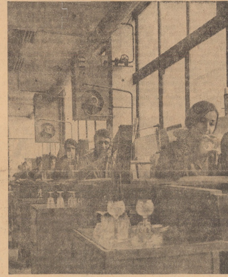
La aceste locuri de muncă sînt amplasate aparaturile de măsură a fabricii „Talometan” din Mediaș, articolele din cristal sînt înobilate prin mișcările valentelor ale celor ce lucrează aici