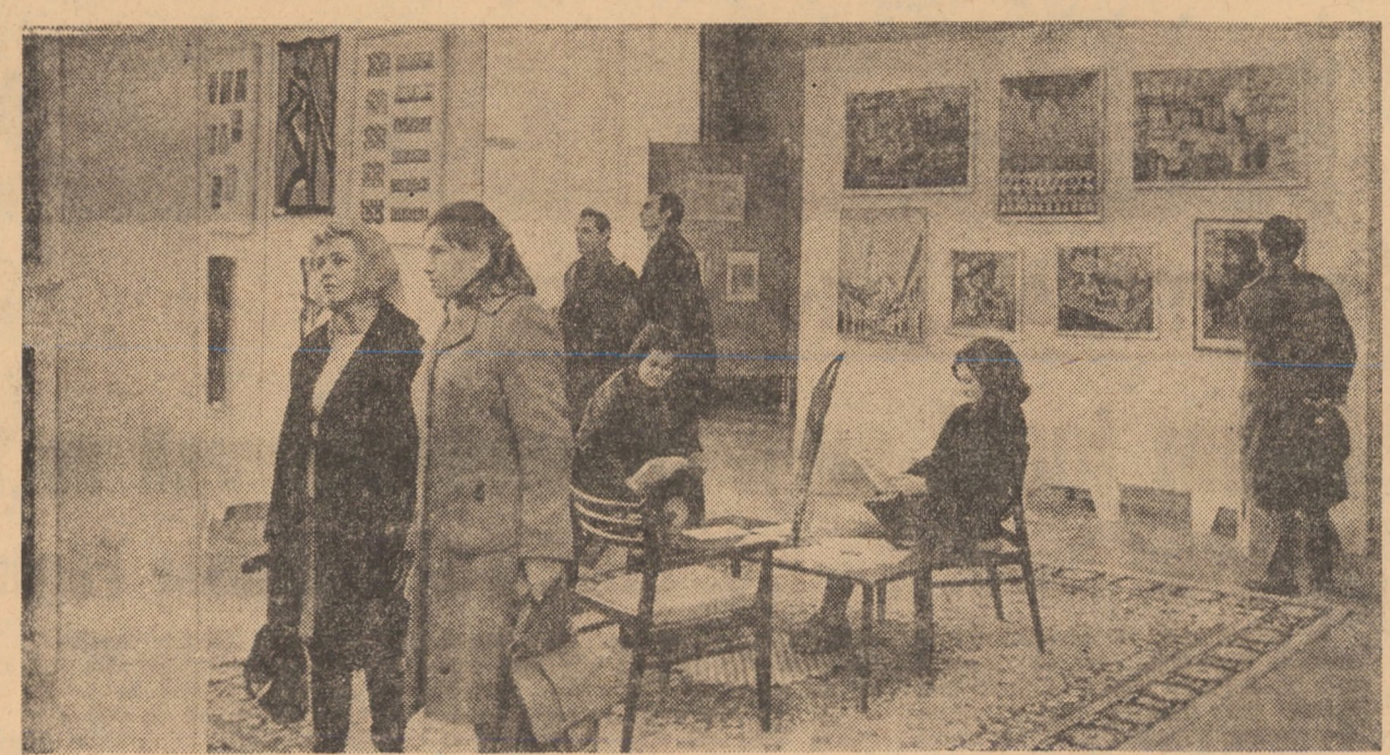
În aceste zile, publicul sibian poate viziona - într-una din sălile Casei armatei din localitate - o reușită expoziție cu lucrări ale cercului de artă plastică „Cornel Medrea” de unde vă redăm imaginea de față

20. Dreptul înent al fiecărui stat la autoapărare individuală sau colectivă.