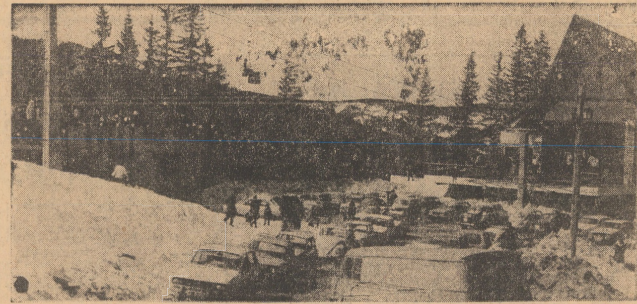
Pălinșul la sfîrșit de săptămîni