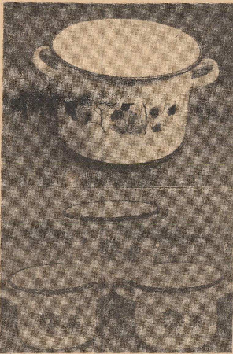
Motivele florale, executate într-o bogată paletă coloristică, decorează expresiv pereții vaselor