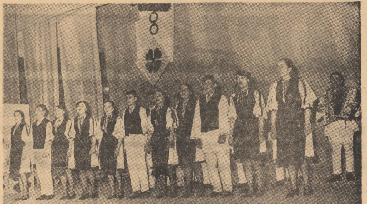
Grupul vocal al Căminului cultural Rășinari. Aspecte de la Festivalul cultural artistic „Mărțișor '74”. Spectacol-concurs a avut loc în 3 martie a.c., la Casa de cultură a sindicatelor din Sibiu