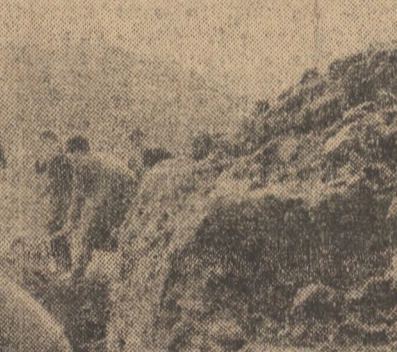
La Motiș, în comuna Valea Viilor, oamenii locului efectuează ample lucrări de îmbunătățiri funciare, reluînd firul unor valoroase tradiții — însemne ale hărniciei și priceperii țărănilor noștri.

LA COOPERATIVA AGRICOLA DIN ALȚINA, grup de primavara, prezintă pe o suprafață de 120 hectare, a fost semănat. De asemenea, a fost încheiat și însămînțatul culturii de orzoacă pe cele 30 hectare planificate. Terenul destinat culturii de ovîz este pregătit și se lucrează în continuare cu 4 discuri.