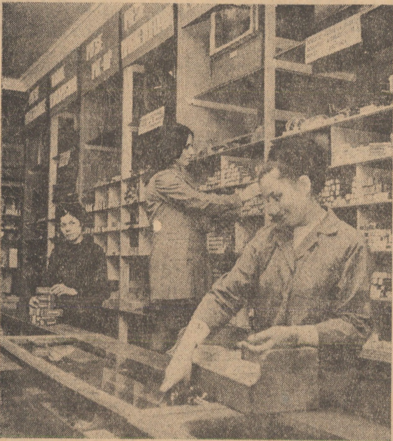
Vă prezentăm o imagine din magazinul „DIODA” redeschis în str. K. Marx din Sibiu de la începutul acestei săptămâni. Unitatea comercială, specializată în piese de schimb pentru aparate casnice (Radio, T.V., mașini de spălat rufe, aspirator, etc.) dispune în prezent de un spațiu de prezentare a marfurilor, măriți, iar expunerea acestora este mai corespunzătoare.