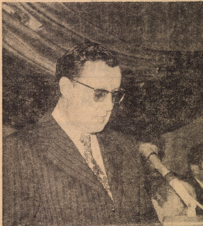
Primul secretar al Comitetului județean de partid prezentind darea de seamă

prezentativă a creșterii conștiinței socialiste a celor ce muncesc. Acest larg consens național, munca plină de avânt a muncitorilor, inginerilor și tehnicienilor, intensa activitate mobilizatoare desfășurată de partid au asigurat un ritm de creștere superior prevederilor inițiale, ceea ce permite ca și realizările din domeniul creșterii veniturilor populației să fie superioare prevederilor din Directive. Iată câteva cifre care ilustrează pregnant modul în care întregul nostru popor dă viață politicii economice a partidului: producția globală industrială înregistrează în acest cincinal o creștere de peste 14 la sută, față de 11—12 la sută cit se prevăzuse inițial; producția globală agricolă crește cu 37 la sută, față de 28—31 cit prevedeau Directivele Congresului al X-lea, creșterea venitului național înscrie un ritm de 12,6 la sută, superior celui prevăzut în Directive, de 7,—