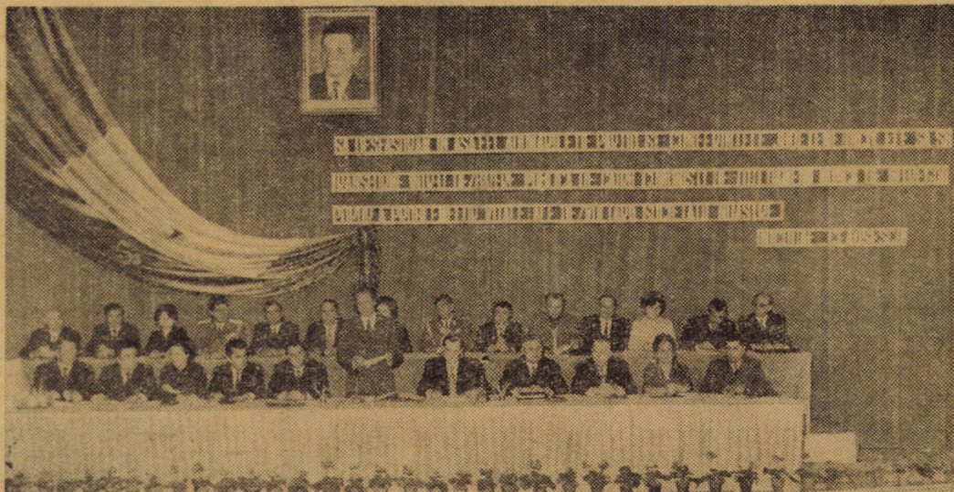
Prezidiul Conferinței organizației județene de partid