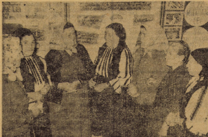
Un grup de delegate la Conferință în timpul pauzei

5. Declarându-și acordul total cu activitatea internațională a partidului, delegații își vor exprima deplina adeziune la politica externă a României, care este orientată spre promovarea fermă a principiilor noi de relații între state - deplină egalitate în drepturi, respectarea independenței și suveranității naționale, neamestecul în treburile interne, avantajul reciproc, nerecurgerea la forță sau amenințarea cu forța. În acest context, se va releva activitatea consecventă a conducerii de partid, în frunte cu secretarul general, pentru dezvoltarea și adâncirea colaborării și cooperării internaționale, a relațiilor de strinsă prietenie cu toate țările socialiste, de largire și consolidare a legăturilor tovarășești, internaționaliste cu partidele comuniste și muncitorești din aceste țări, de întărire a unității mișcării comuniste și muncitorești mondiale, a prieteniei și colaborării cu noile state suverane și de sprijinire a mișcărilor de eliberare națională, de dezvoltare a relațiilor cu mișcările democratice și progresiste, de promovare a păcii și securității în Europa și în întreaga lume.