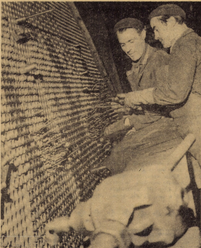
Cazangeria Independentă Sibiu. Mandrinarea țevilor la un evaporator de 30 tone destinat industriei alimentare