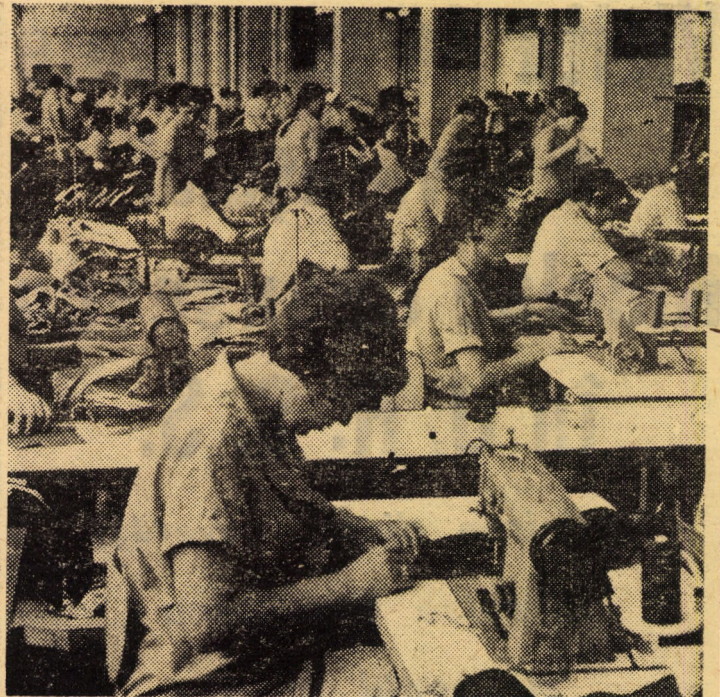
Întreprinderea de confecții „Steaua roșie”. Aspect dintr-una din secțiile de producție