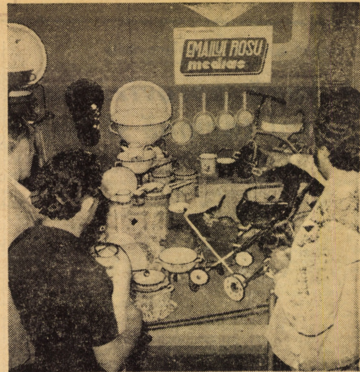
Citeva din produsele cunoscutei întreprinderi „Emailul roșu” Medias.

Condițiile de muncă ale muncitorilor direct productivi cunosc zilnic îmbunătățiri substanțiale, iar preocupările pentru îmbunătățirea acestora se amplifică pe multiple planuri. O analiză recentă făcută în cadrul plenarei largite a Consiliului municipal al sindicatelor Medias a evidențiat activitatea organizațiilor sindicale din întreprinderi coroborată cu cea a compartimentelor de protecție a muncii și medicale, pentru asigurarea și perfecționarea continuă a condițiilor sociale necesare desfășurării unei activități eficiente. Spre exemplificare, numărul certificatelor medicale acordate în semestrul I al acestui an pentru incapacitate temporară de muncă au scăzut cu 1633 față de aceeași perioadă a anului trecut, iar numărul de zile acordate în aceeași perioadă de comparație s-a diminuat cu 6374. Rezultatele evidențiate la nivel de municipiu sînt îmbu-