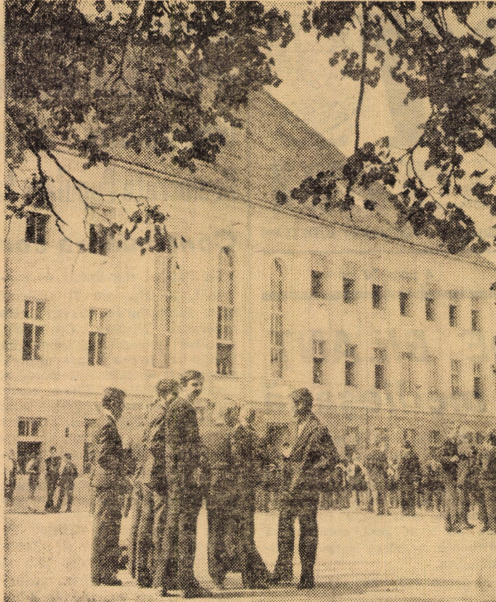
„Șuete” în pauză și eterna întrebare: „Oare ne dă extemporal?”...