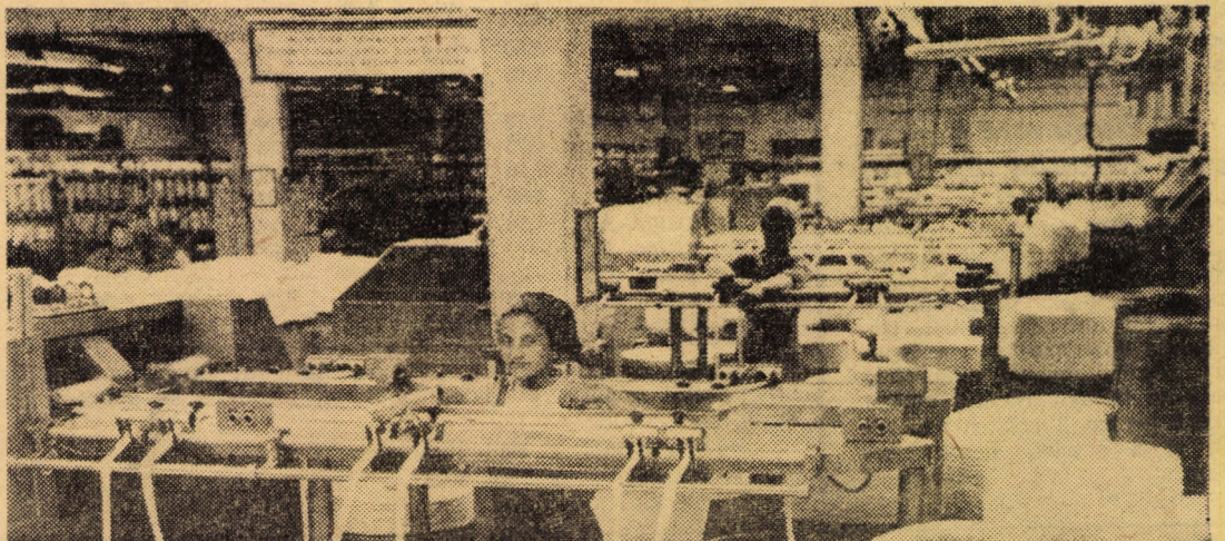
„11 Iunie” Cisnădie — secția prepararea filaturii. Omogenizarea firelor de bumbac se realizează cu laminoare cu mare productivitate.