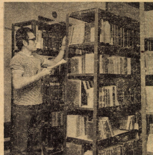
Depozitul de cărți vechi al muzeului „Valea Hirtibaciului“ din Agnita