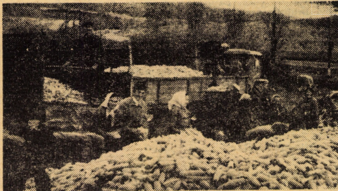
Duminică cooperatorii din cadrul fermei Șeica Mare s-au prezentat în „Perimetrul Nou” la sortarea porumbului

Din bucătărie toți Inghijitorii preiau rațiile pe bază de cîntar. Nu se admite nici o risipă.