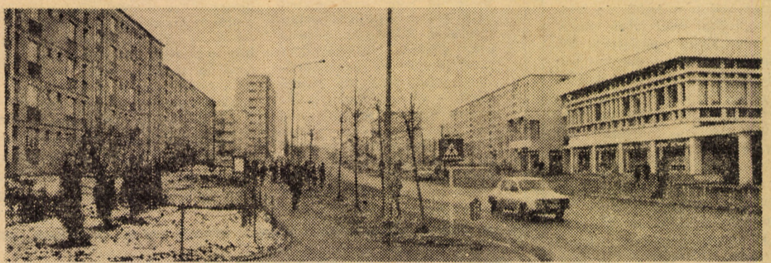
În centrul de județ, pe coordonatele urbanismului și sistematizării circulației rutiere, pietonale