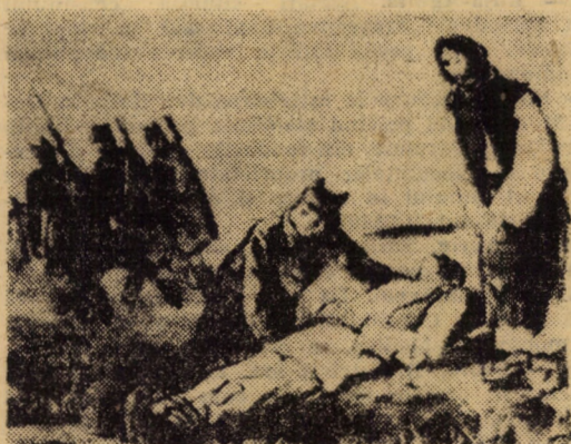
„Tatăl și fiul” (1907) (AUREL LIQUID)

Prima luare de atitudine față de evenimentele tragice din România o întîlnim în nr. 7 din 1.IV.1907. Răbunirea țărănească desvelise adevărata stare socială de peste munți, iar brutala reacție a guvernărilor eclipsase rușinos „soarele care răsărea la București” pentru românii din Transilvania. Articolul „Tulburările din România (Cronică)” apare nesem-