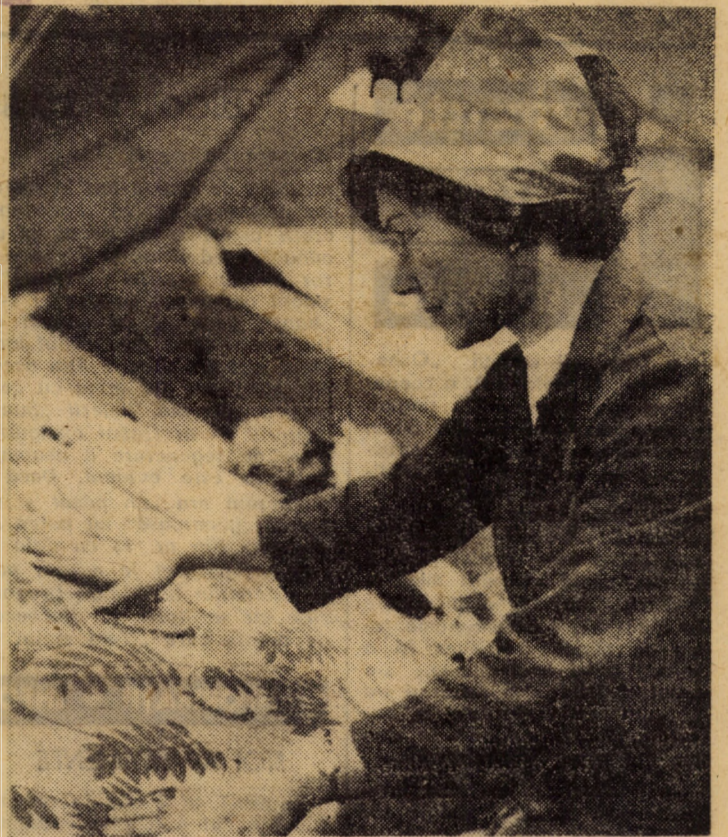
Întreprinderea „Tirnavă” Medias. O atenție mărită se acordă depistării eventualelor defecțiuni la rampa de control a țesătoriei

La ora 10,00, ora locală, avionul prezidențial decolează, îndreptându-se spre Accra — capitala Republicii Ghana.