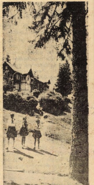
Zile de vacanță