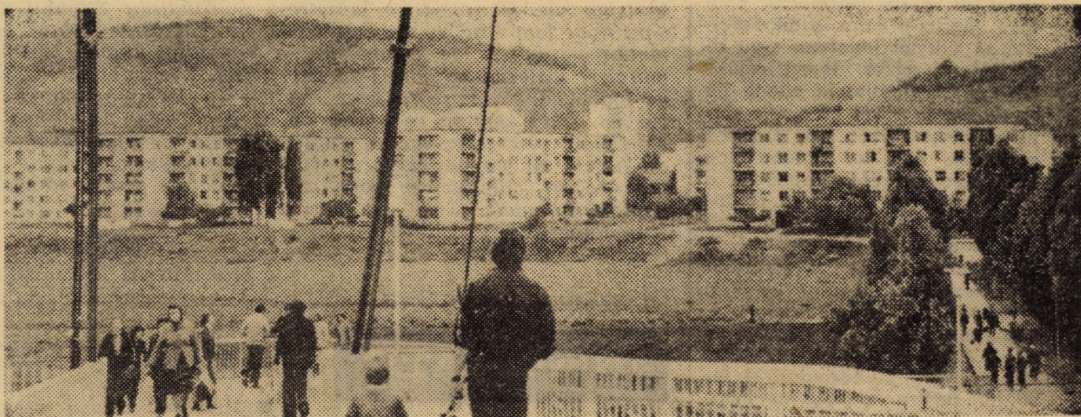
În drum spre cartierul de locuințe Gheorghe Gheorghiu-Dej din municipiul Mediaș

(Continuare în pag. a III-a) ION SORESCU