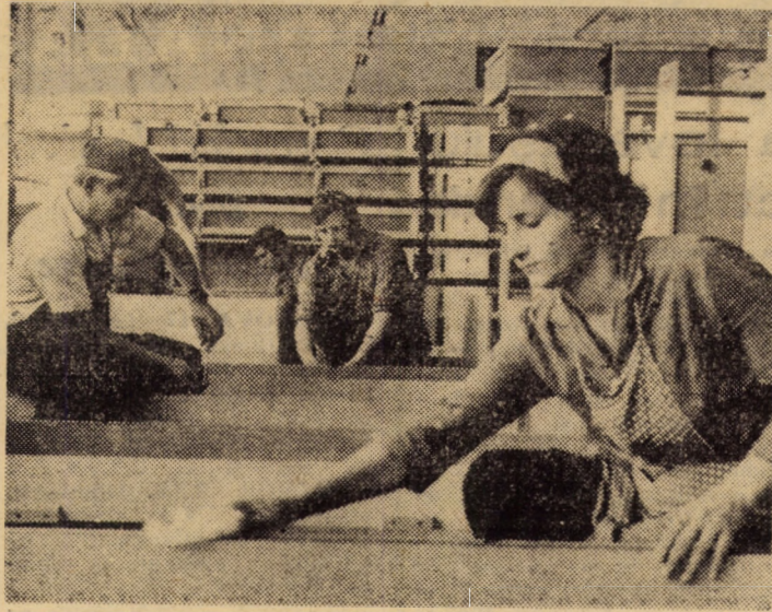
Acordind o mare atenție calității produselor întreprinderea de prelucrare lemnului Sibiu a devenit o firmă bine cunoscută peste hotarele țării. Este suficient să amintim că circa 90 la sută din producția de mobilă executată aici este destinată exportului. În imagine: secția montaj din cadrul sectorului II

Din inițiativa comitetului executiv al Consiliului popular municipal au mai fost organizate astfel de întâlniri între cetățeni și deputați în circumscripțiile 45, 46 din Tereziian și urmează să se mai organizeze un dialog direct de acest gen și în alte circumscripții unde sunt probleme care necesită sprijinul organelor municipale sau al celor județene.