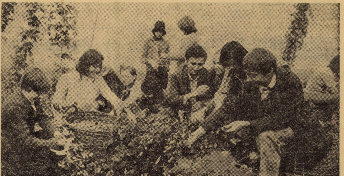
I.A.S. Șura Mică — ample acțiuni de muncă patriotică, la recoltarea hameiului

(Continuare în pag. a III-a) NICOLAE TULICI