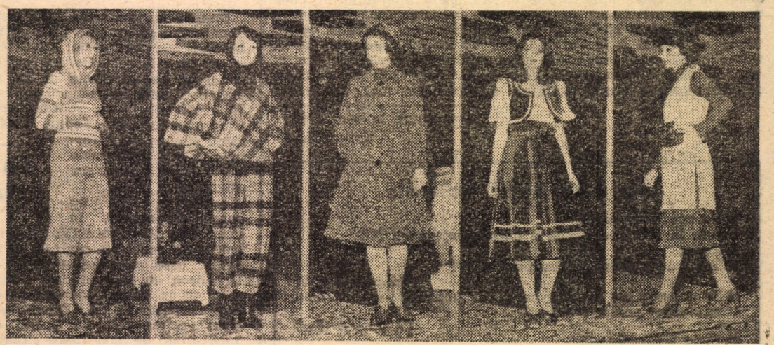
Vă prezentăm cîteva din noile modele de îmbrăcăminte, executate de cooperația meșteșugărească din județ, recent apreciate de sibieni în cadrul unei „Parade a Modeli”, desfășurată în saloanele restaurantului „Împăratul Romanilor”.