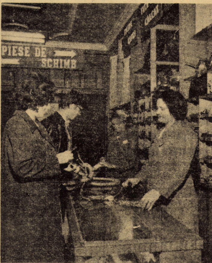
Recent fostul magazin nr. 112 „Dioda” din str. K. Marx din Sibiu, a fost reprofilat pe piese de schimb pentru articole electro-casnice

Ne aflăm pe ultima „linie dreaptă” a anului economic 1977. Evident, sarcinile și obiectivele acestei etape sînt deosebit de complexe pentru că ele privesc nu numai realizarea planului și angajamentelor din acest an, ci și pregătirea temeinică, minuțioasă a lui '78. Iată de ce, îndatorirea primordială a organizațiilor de partid, a consiliilor oamenilor muncii, a tuturor celor ce muncesc în industria județului constă în amplificarea eforturilor și activităților productive, împletirea acestor eforturi cu o mai bună organizare a muncii, cu folosirea superioară a timpului productiv, a capacității utilajelor și instalațiilor, cu strădanția de a munci mai eficient, cu spirit gospodăresc. Trebuie să fim pătrunși de convingerea că bilanțul acestui an, îndeplinirea exemplară a angajamentelor județului se vor hotărî în această ultimă pătrime a anului și trebuie, mai ales, să acționăm concret și operativ, la toate locurile de muncă pentru realizarea a ceea ce ne-am propus. Trimestrul care ne stă în față nu poate, nu trebuie să fie altceva decît un trimestru al producțiilor record!