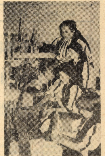
poziție de elevi ai Școlii generale din Cîrțișoara.

acest prilej, rolul de catalizator al potențelor creatoare ale poporului nostru, exercitat de festivalul „Cîntarea României”, ne facem o plăcută datorie față de publicul cititor informînd în final asupra inspiratului și frumosului recital de cîntec și poezie dat după vernisaj în sala de ex-