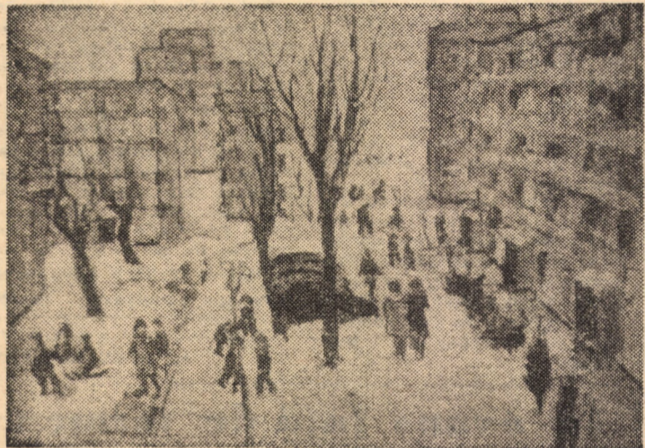
Una din lucrările Expoziției, intitulată „lama in Hipodrom”