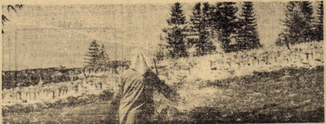
În urma bunelor rezultate obținute pînă acum la Ferma de giște din Păltiniș a întreprinderii „Avicola” Sibiu, s-a hotărît ca o parte din efectivul de păsări să ierneze în cadrul fermei amintite unde sînt asigurate condițiile necesare în acest scop, studiindu-se totodată comportarea lor pe timp de iarnă

ba și li se juoate omușorul, cercînd ba să le scape printre dinți, ba să se scufunde în hăul burdihanului. Și cînd țalul le smulge scaunele de sub ei și le așază cu picioarele-n sus peste foituri și stacane, se despart dîndu-se cap în cap pe trotuar și-o iau către casă. La așața să vedeți hobby-uri și talente etalate cu dezinvoltură, de regulă după ptimul cîntat al cocoșilor. Unul își pune nevasta să-i facă papanași, altul își scoală copiii și le-ascute inteligența dîndu-le să înnulțască în gînd pe 9572 cu 27.59, iar rezultatul să-l împartă la cîți membri are familia lor unită, altul își