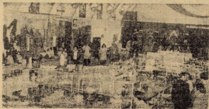
Imagine de ansamblu EXPO '78