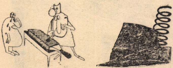
Desen de: ADRIAN POPESCU