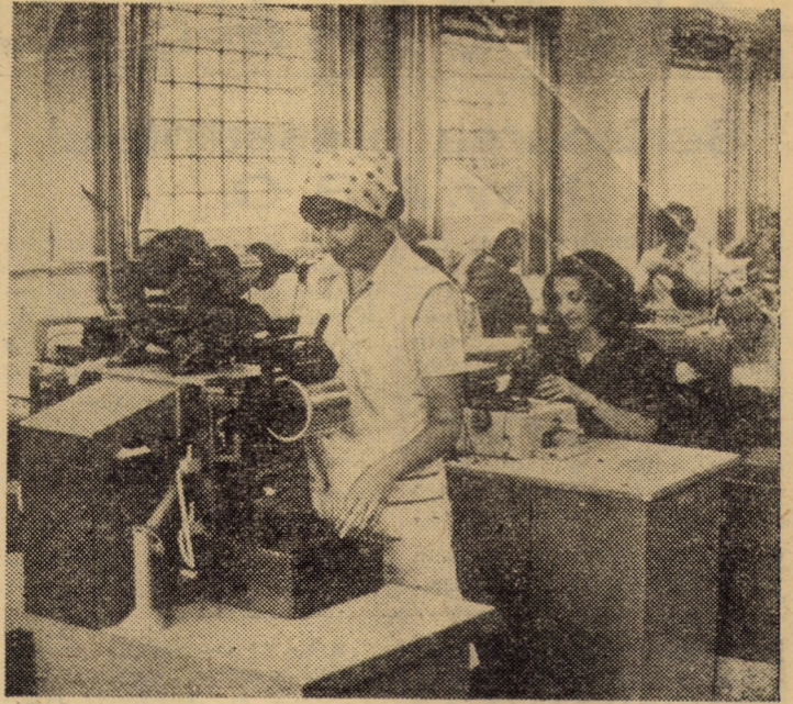
Linia de cusut mecanic pentru încălțăminte, tip mocasin, la Fabrica de încălțăminte și pielărie Agnita.