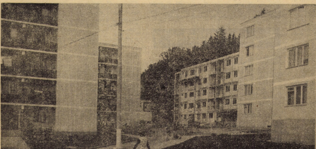
Noi construcții de locuințe ridicate recent în orașul Agnita

La Liceul de matematică-fizică „Gh. Lazăr” Sibiu, se mai fac înscrieri pentru cl. a IX-a, secția serală cu profil de matematică-fizică. Se primesc cereri de înscriere pentru clase în două schimburi (76 locuri).