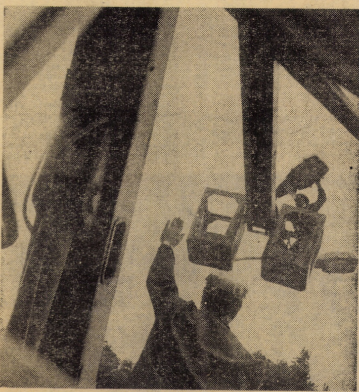
Imagine surprinsă din munca de zi cu zi a lucrătorilor serviciului deranjamente al întreprinderii de rețele electrice Sibiu, în timpul unei intervenții în centrul orașului