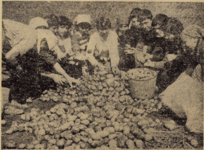
Elevi de la Liceul mecanic din Avrig, recotind cartofi în cadrul practicii agricole pe care o execută

Comitetul județean Sibiu al U.T.C. organizează începând de astăzi, timp de 4 zile, instruirea comandantilor de detașamente în cadrul activității de pregătire a tineretului pentru apărarea patriei. Instruirea se va desfășura în 3 centre ale județului — Sibiu, Mediaș și Agnita (C.A.).