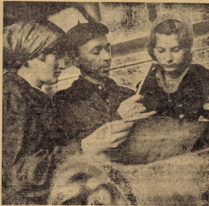
Secvență surprinsă într-una din secțiile întreprinderii „Mecanica“ Sibiu: a început practica în producție a elevilor de la Școala profesională