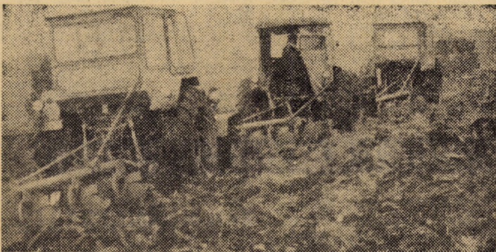
Mecanizatori de la S.M.A. Loamneș efectuînd arături în vederea însămînțării