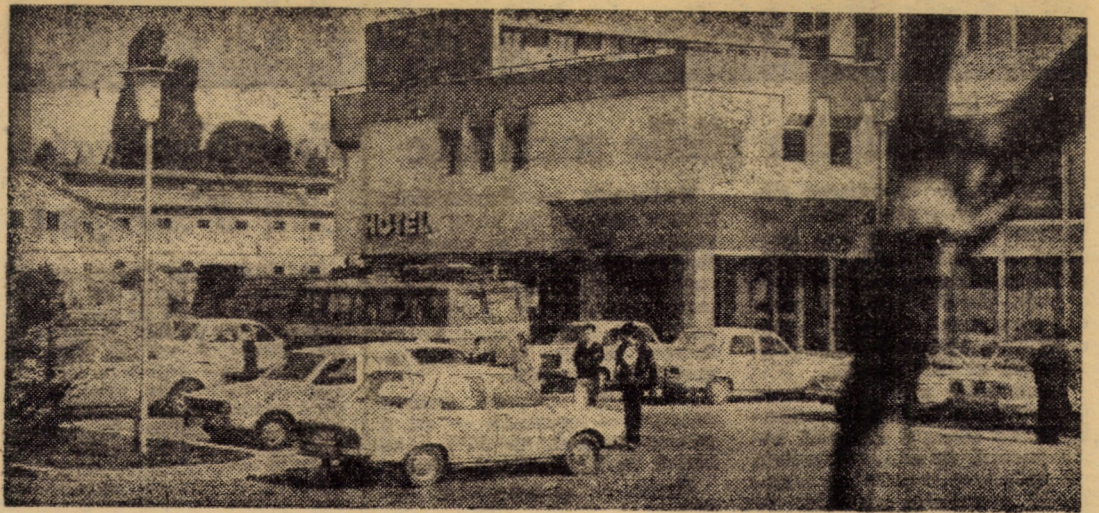
Hotelul „Continental” din Sibiu: loc de popas pentru mulți dintre turiștii care ne vizitează urbea