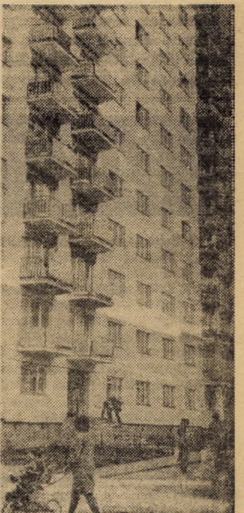
Printre frumoasele construcții de locuințe cu zece etaje ale cartierului „După zid” din municipiul Mediaș

(Continuare în pag. a III-a) TRAIAN SUCIU