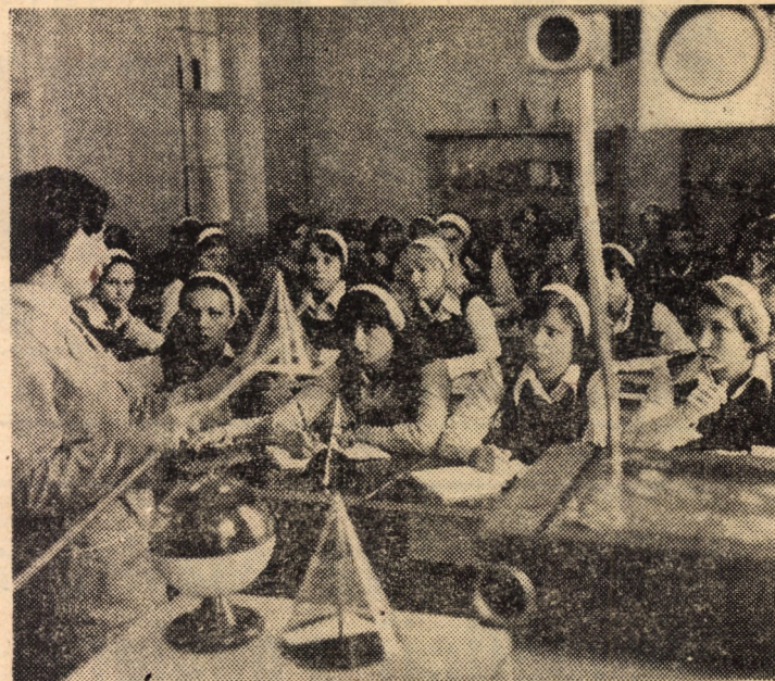
La Grupul școlar M.I.U. Sibiu a fost amenajat un cabinet de matematică cu 40 locuri, dotat cu un retroproiector și un bogat material didactic.

* Nicolae Branga, „Aspecte și permanențe traco-romane”, Editura „Facla”, 150 pagini, lei 6,75.