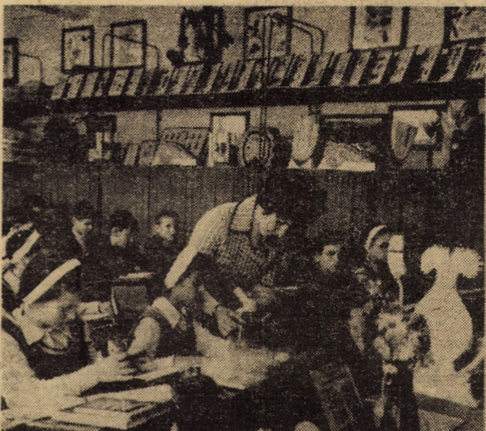
Pentru elevii Școlii generale nr. 3, Copșa Mică, orele de biologie se desfășoară în condiții optime în laboratorul dotat cu un bogat material didactic, confecționat în bună parte chiar de ei