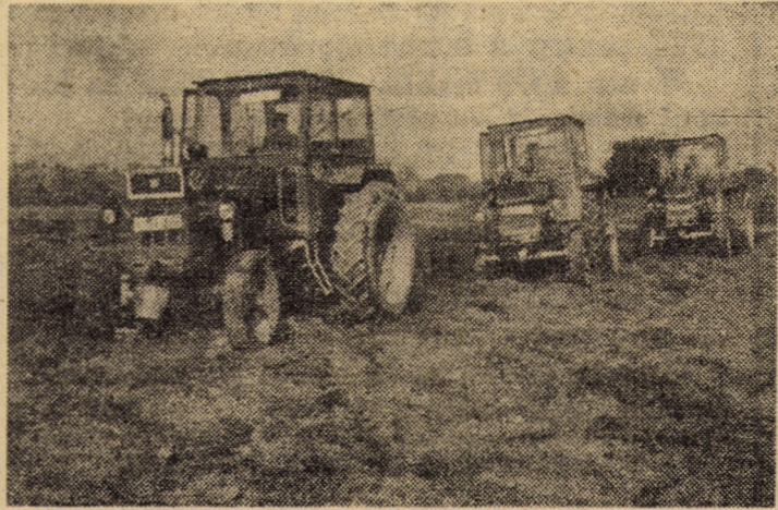
Arăturile sînt în obiectivul preocupărilor și la C.A.P. Cîrțișoara de unde vă redăm imaginea de mai sus

(Urmare din pag. 1) finale acțiunea de semănat orz de iarnă. În ce privește grîul, situația se prezintă în felul următor: