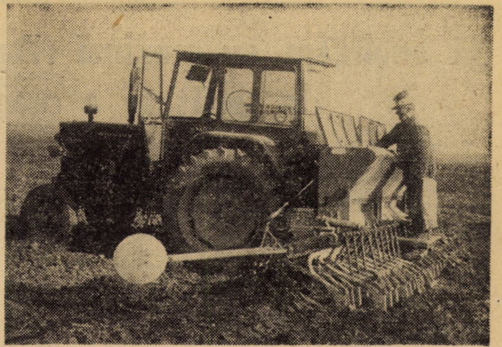
La C.A.P. Cırța însămînțatul griului a ajuns doar la 32 la sută