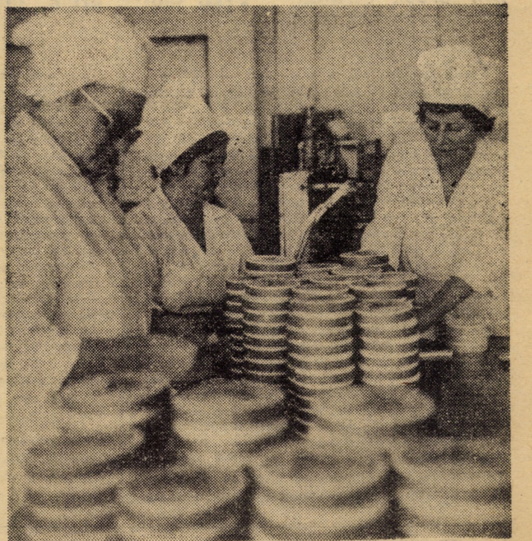
Sectorul de etichetat și ambalat brînzeturii topite al întreprinderii de industrializarea laptelui Sibiu