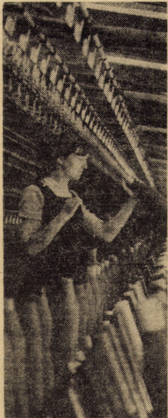
Intr-una din noile hale de producție cu mașini de răsucit de la întreprinderea „Dumbrava” Sibiu.