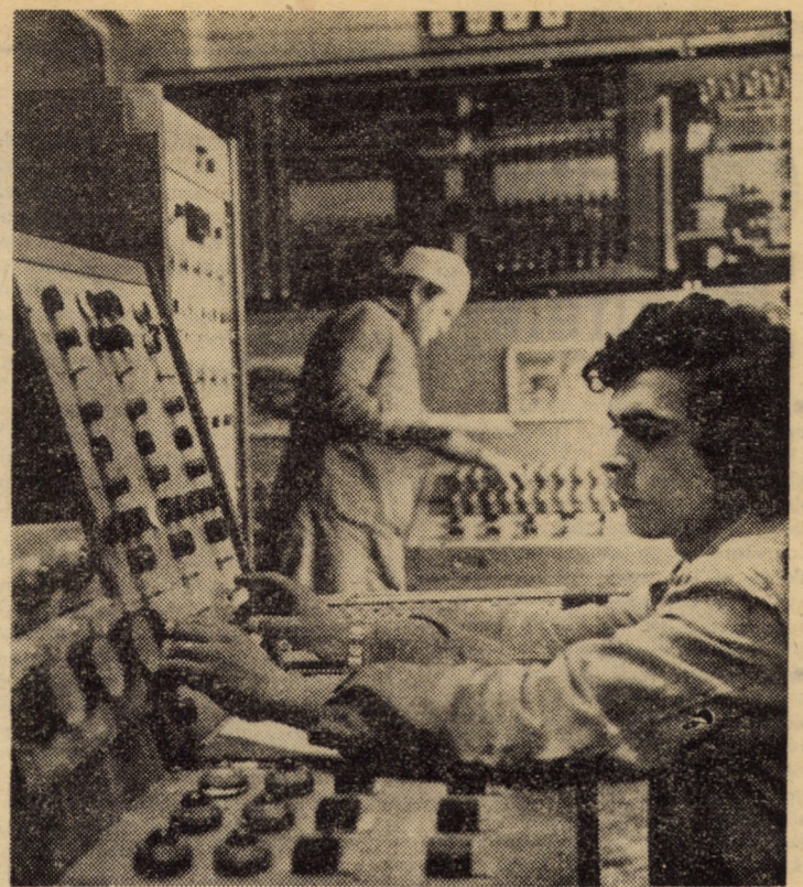
La pupitrul de comandă al dozatorului automat pentru macrocomponente de la întreprinderea pentru producerea nutrețurilor combinate Sibiu

Astăzi, în jurul orei 11,30, posturile de radio și televiziune vor transmite direct ceremonia sosirii președintelui federal al Republicii Austria, dr. Rudolf Kirchschläger care, împreună cu doamna Herman Kirchschläger, va face, la invitația președintelui Republicii Socialiste România, tovarășul Nicolae Ceaușescu, și a tovarășei Elena Ceaușescu, o vizită de stat în țara noastră.