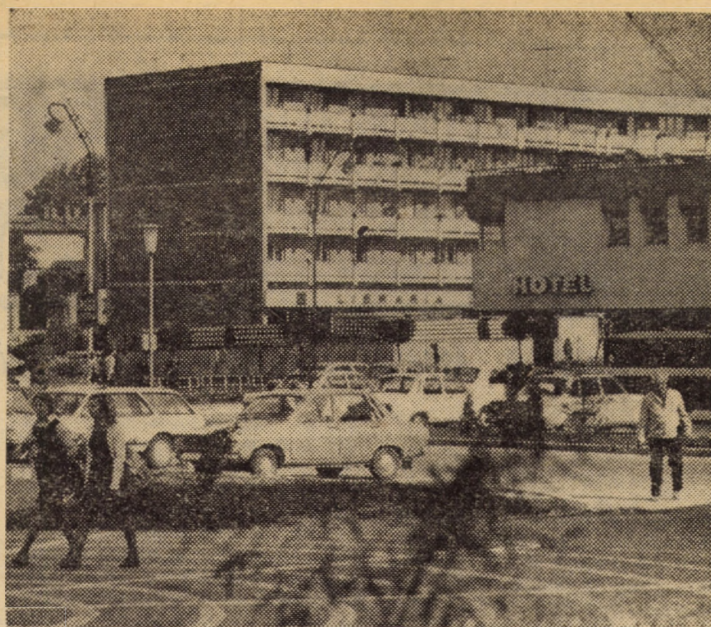
Sibiul contemporan — semnificativă carte de vizită a succeselor oamenilor muncii, români, germani și maghiari, de pe aceste meleaguri

Sîntem dator să precizăm că problema acestor deșuri nu este tocmai nouă, fiind încă de prin 1970 în atenția minis-