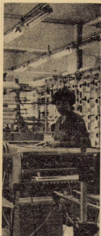
Unul din urzitoare de mare capacitate de la sectorul I al întreprinderii „Drapelul roșu” din Sibiu

(Continuare în pag. a III-a) ION SORESCU