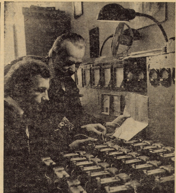
Numeroase întreprinderi din țara noastră dispun de o bază tehnică corespunzătoare înaltelor exigențe ale producției ce se realizează cit mai competitiv. Un exemplu concludent îl constituie și ICEMENERG — filiala Sibiu. Aspect de la standul pentru verificarea electrică a releelor de semnalizare prin impulsuri, folosite în industria constructoare de mașini

Față de anul în curs sarcinile indicatorului producției netă prevăd o creștere de 15 la sută, preconizată a se realiza integral ca urmare a creșterii productivității muncii. Ce s-a întreprins, mai pre-