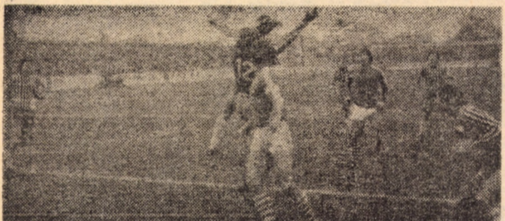
Fază din meciul F. C. Șoimii - Poiana Cîmpina

ALPINISM Miercuri 22 noiembrie, ora 19, în sala mare a Casei de cultură a sindicatelor, Emilian Cristea, maestrul al sportului, antrenor emerit, va prezenta o serie de diapozitive color din cele mai frumoase trasee de cățărare din țara noastră. Din expunere nu vor lipsi peisajele insolite ale marilor fisuri din Bucegi, Cheile Bicazului și din alți masivi. Accesul în sală, numai pînă la ora 19,10.