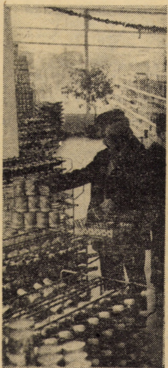
În magazinul alimentară cu auto-servire din cartierul medieșean de locuințe „După zid”

(Continuare în pag. a III-a) DUMITRU MANIȚIU