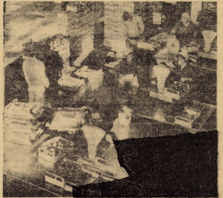
Pregătirea și ambalarea produselor de export la Întreprinderea Sere din Dumbrăveni.

OPREA SURDU, deputat circ. nr. 11 Poplaca