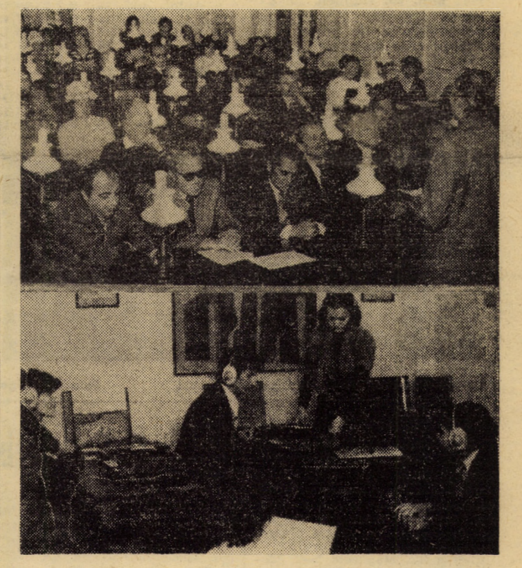
Aspecte de la momentul inaugural al secției muzicale din cadrul Bibliotecii „Astra“

piul Sibiu și I.J.G.C.L. Sibiu către toate consiliile populare municipale și întreprinderile similare din țară. Astfel, planul de producție prestații a fost depășit cu 21 milioane lei, planul de beneficii cu 3,1 milioane lei, s-a realizat o economie de combustibil de 130 tone etc., asigurîndu-se toate condițiile pentru realizarea integrală a angajamentelor asumate. Preocupările noastre viitoare vizează îmbunătățirea ba-