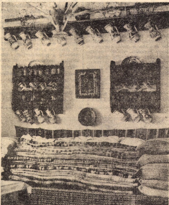
Interior jărănesc din comuna Rășinari (Muzeul etnografic)

Rezultatele la care au ajuns cei doi autori în cea dintâi lucrare a lor, publicată, pentru teatrul de amatori îi îndreptățeste, după părerea mea, să persevereze în acest domeniu, foarte sărac în scrieri relevabile. EUGEN ONU