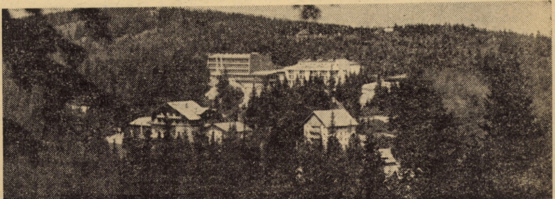
Panoramic al stațiunii climatice Păltiniș

Rezultatele concrete obținute în reducerea mai substanțială a cheltuielilor materiale vor constitui fără îndoială măsura eficienței muncii desfășurate de colectivele de oameni ai muncii din unitățile economice ale județului nostru.