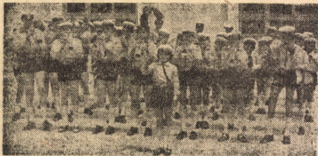
Fanfara Casei pionierilor și șoimilor patriei din Mediaș, câștigătoare a locului II pe țară la „Cîntarea României”

Casa pionierilor și șoimilor patriei Mediaș