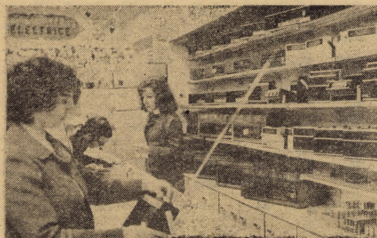
La cele două raioane specializate ale magazinului „Ferometal” din Sibiu, de la începutul anului și pînă în prezent au fost vîndute un număr de 570 televizoare și 750 radio receptoare.