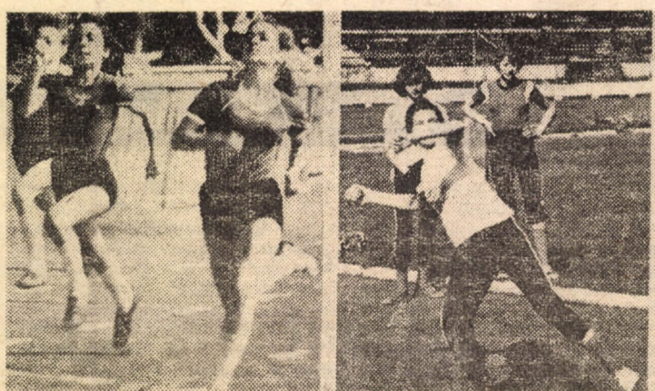
Peste 150 de sportivi au participat la etapa județeană a concursului republican de tetratlon, rezervat elevilor din școlile generale. În imagine aspecte din timpul concursului

Miine de la ora 10, pe terenul Voința se desfășoară meciul de campionat C.S.M. — C.F.R. Brașov. G. DEAC